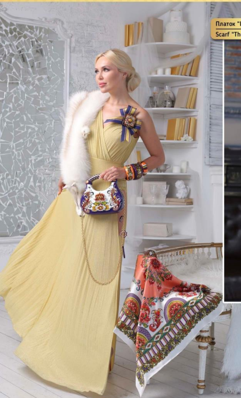
Scarf "The Swan Princess"