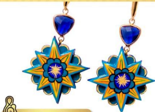
Серьги "Золотой петушок" Earrings "The Golden Cockerel"