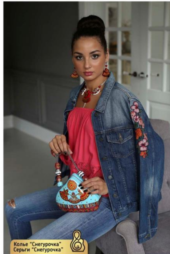
Колье "Снегурочка" Серьги "Снегурочка" Necklace "The Snow Maiden" Earrings "The Snow Maiden"