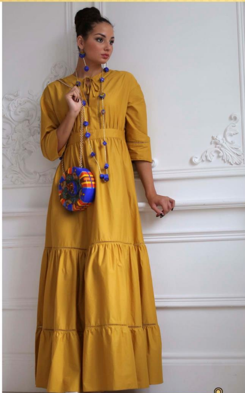
Колье "Золотой петушок" Серьги "Золотой петушок" Necklace "The Golden Cockerel" Earrings "The Golden Cockerel"